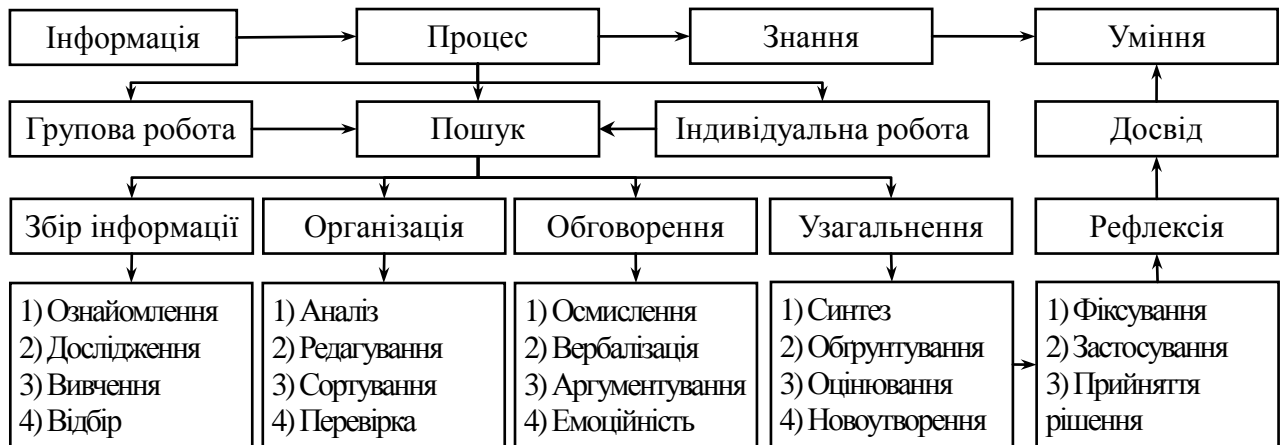
Рисунок 1 – Структурна схема процесу розвитку вмінь розв'язувати проблемні ситуації

експерименту, викладено організацію перевірки стану сформованості у майбутніх офіцерів-прикордонників умінь розв'язувати ПС, обґрунтовано педагогічні умови та подано модель.